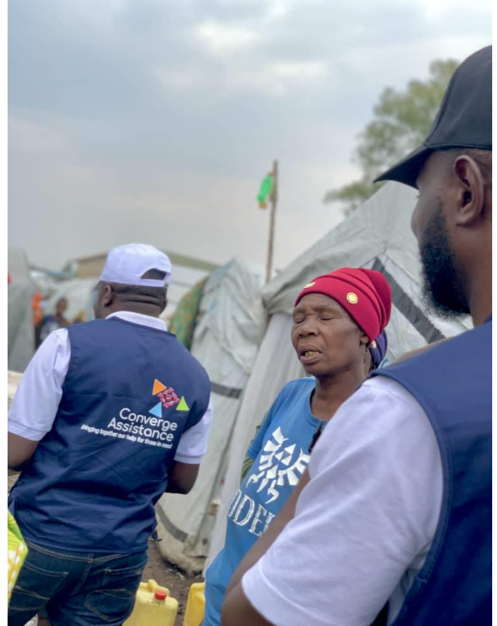
Les responsables de suivi évaluation de converge Assistance collectant les données auprès des ménages dans le camp de Don Bosco. Décembre 2024